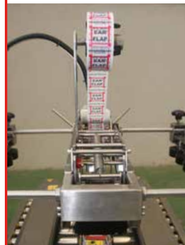
Cabezal de precintado

La calidad y formato de las cajas deberá ser verificado y aprobado por la oficina técnica de EARFLAP