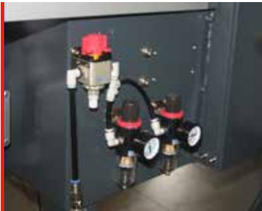
Medidores presión aire

Otros colores bajo petición (puede suponer un extracoste)