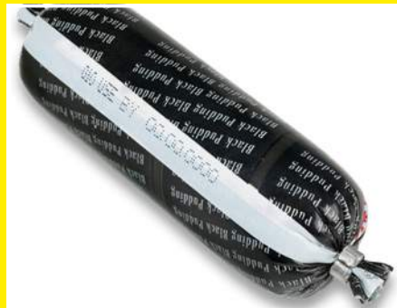
Marcado de productos por impresión directa sobre film