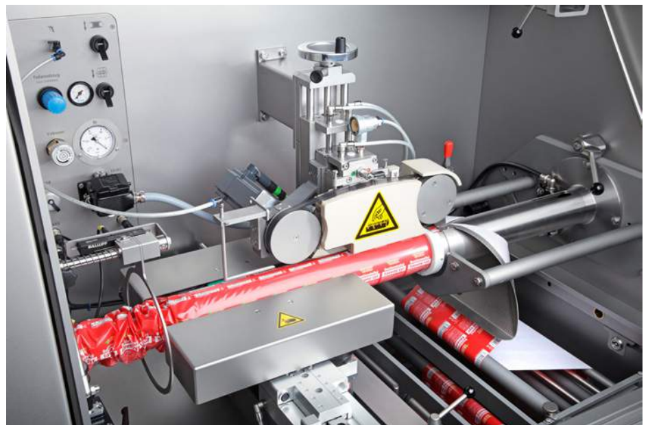
Estación de sellado en caliente de la TSCA para un sellado fiable

El sistema completo formado por una máquina grapadora, grapas y cordeles, todo en uno, asegura una producción eficiente y sin fallos. Las grapas originales de Poly-clip System garantizan la máxima calidad. La fabricación se somete a las más estrictas pruebas de calidad. Con certificación en conformidad con ISO 22000 e ISO 9001, están hechas a la medida exacta del proceso de producción. La tecnología SAFE-COAT de Poly-clip asegura una producción sin fallos y la tranquilidad de un revestimiento de seguridad apto para alimentos, certificado por el SGS INSTITUT FRESENIUS. Poly-clip System es el proveedor líder a nivel mundial de soluciones de sistemas de grapado.