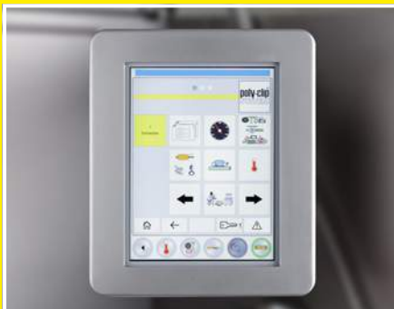
TSCA SAFETY TOUCH: panel de control táctil sencillo y claro