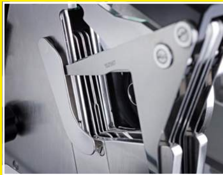
Tijeras se pueden ajustar al calibre de cada producto para un número de ciclos elevado