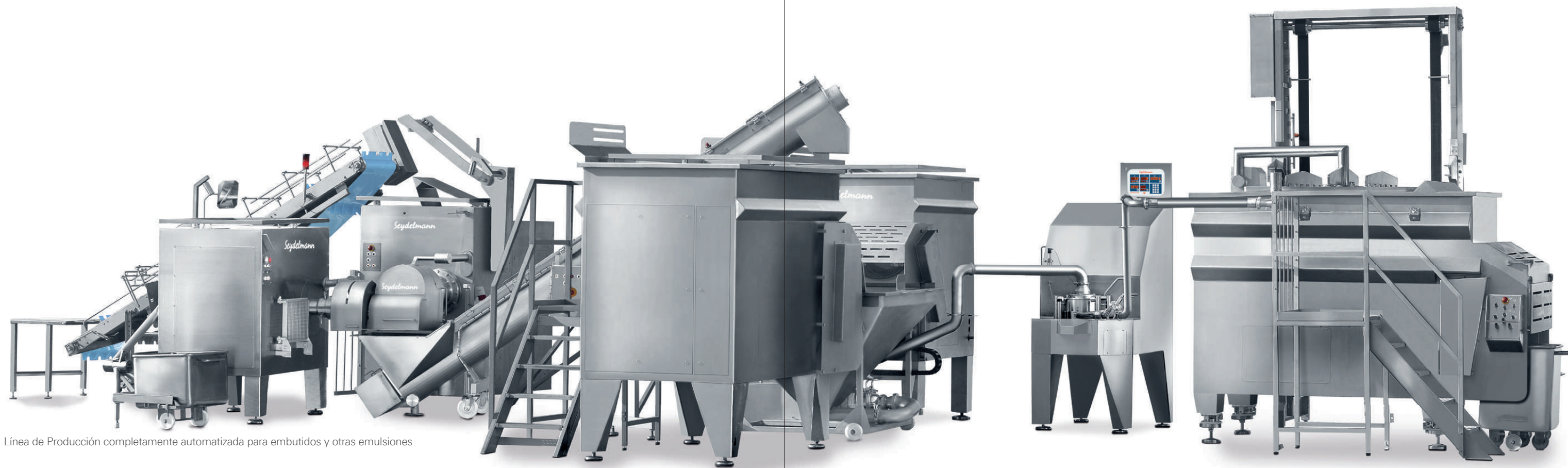
Línea de Producción completamente automatizada para embutidos y otras emulsiones