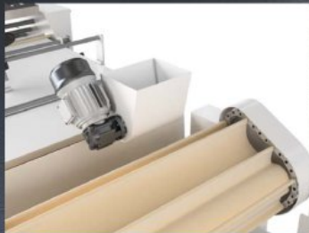
The shaper is fitted with a standard automatic flour-applier. Die Teigformmaschine ist serienmäßig mit einem automatischen Mehlbestreuer ausgestattet.

Die CM stellt Ihnen schnell platzsparend alle Vorteile einer industriellen Teigform- und Absetzstraße zur Verfügung. Ihre Produktion von bis zu 1500 Stück/Stunde, das zwischentzeitliche Ruhe der Teige und die Möglichkeit, mit bis zu 100 cm großen Blechen zu arbeiten, machen sie zu einer perfekten Hilfe für den Beginn einer Serienproduktion.