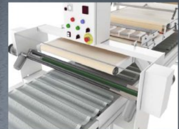
The dual action aligner/depositor allows several pieces to be deposited per tray channel. Die Tandem-Zentrier-Absetzvorrichtung ermöglicht das Absetzen mehrerer Stücke pro Blechkanal.