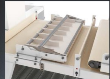
Equipped with multi edge system for small pieces and recovery unit tips.