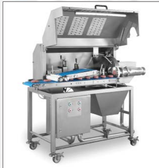
Máquina de conformación FM250

Benefíciense de las reducidas necesidades de rework y del alto aprovechamiento de la materia prima utilizada.